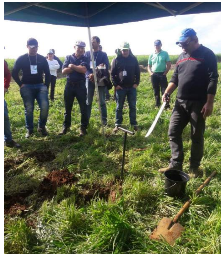
Demonstração de como coletar corretamente uma análise de solo