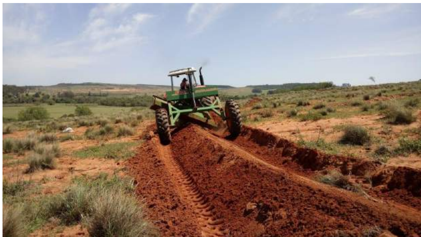
Construção de terraços em campo nativo São Francisco de Assis