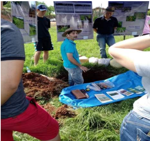
Dia de campo - pastagens e solos na produção de leite e lavouras Relvado