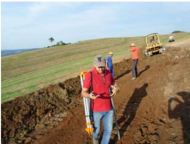
Construção de terraços Estrela Velha e Itapuca – Auxílio Pref. Municipal