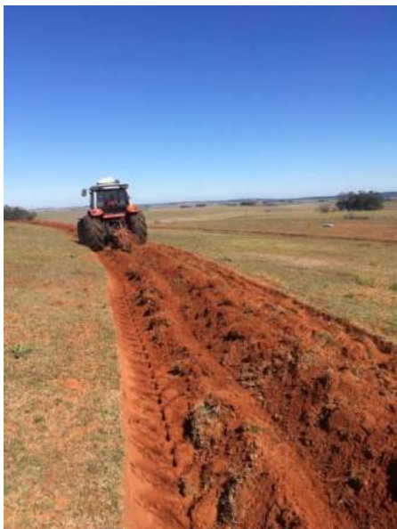
UR - Sistema silvipastoril São Francisco de Assis