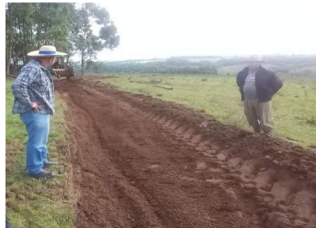
Construção de terraços em campo nativo solos arenosos - Formigueiro