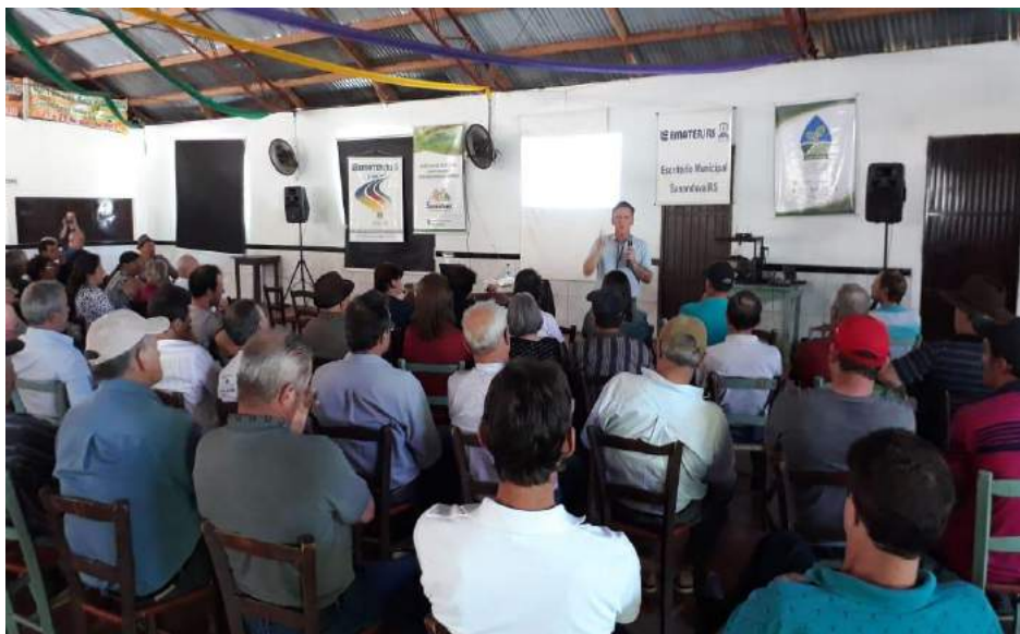
1 Encontro Técnico Familiar de Sananduva - RS