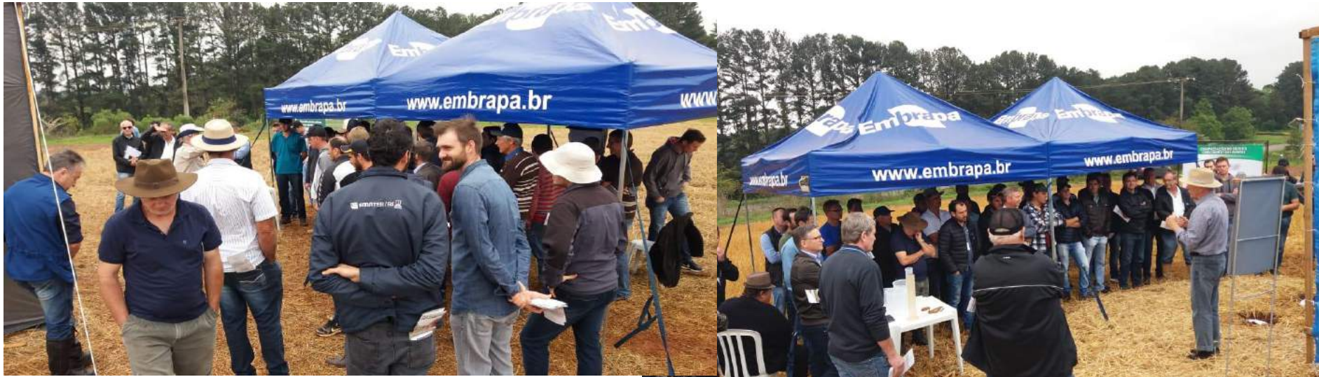
Excursão Erval Grande - Dia de campo - Manejo do Solo e da Água Embrapa Passo Fundo