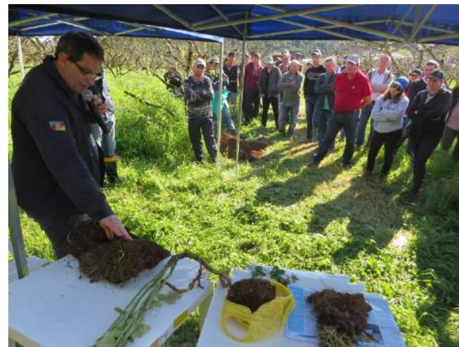
Dia de campo Veranópolis