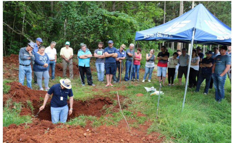
Tarde de Campo do Programa de Gestão Sustentável da Agricultura Familiar - Encantado